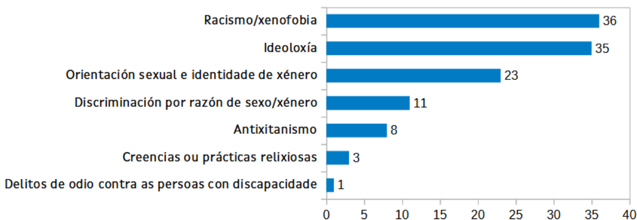
Táboa 1: Número de incidentes de odio por colectivo. Galicia. 2023